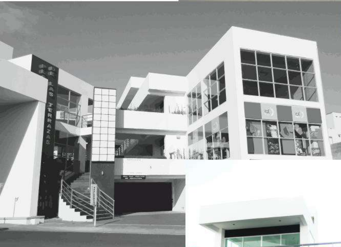
PLAZA TERRAZAS El Mirador