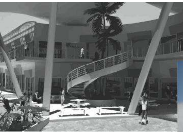
PLAZA BRISAS Milenio III