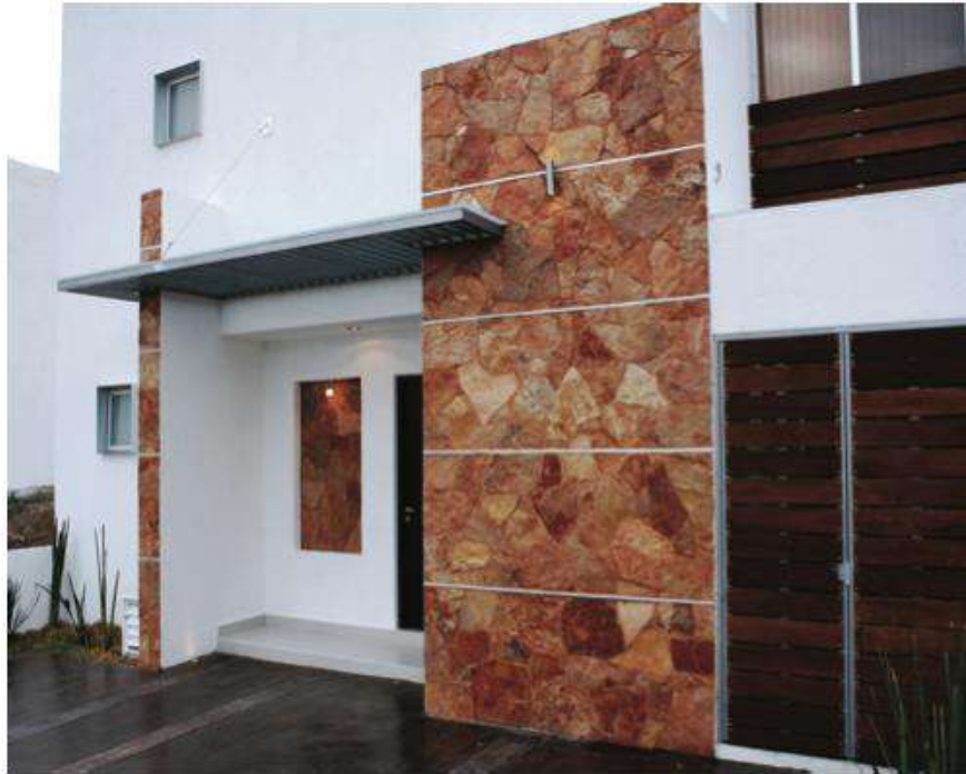
Integración de materiales