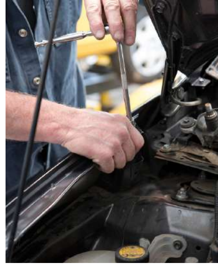
REPARACIONES DE MOTOR