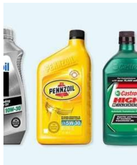
ACEITE 5W EN ADELANTE